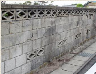
ブロック塀のヒビ