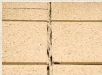
シーリング材の劣化